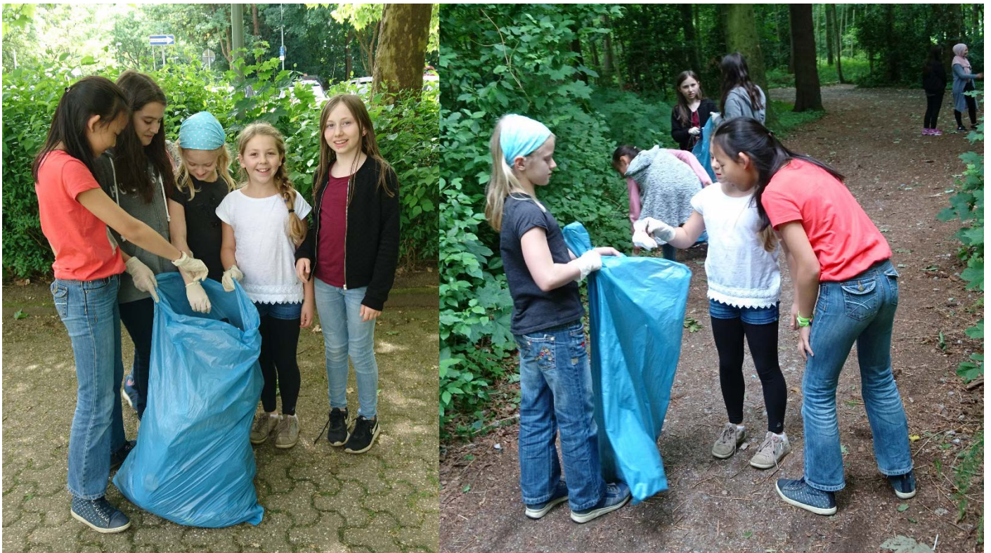
Die Umweltdetektive bei einer der Müllsammelaktionen im Sommer 2017

Das Thema Müll beschäftigt uns in beiden AGs immer wieder, da viele von uns auf dem Schulweg durch ein kleines Stückchen Wald gehen, das immer verschmutzt ist. Mülleimer sind zwar vorhanden, aber sie sind oft überfüllt. Vielleicht hilft diese Fotostory dabei, dass alle Schüler den Müll bis zum nächsten Mülleimer tragen.