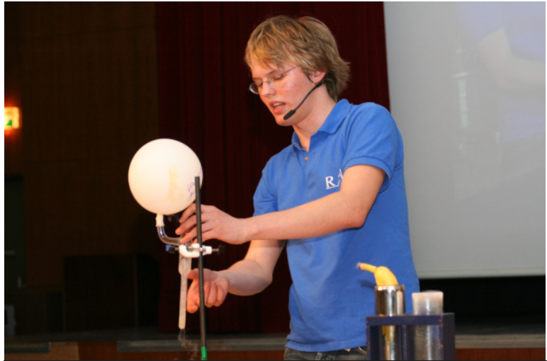
Spannender Vortrag der RINO-Foundation der Universität Leiden in unserer Aula.